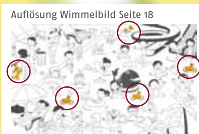
Auflösung Wimmelbild Seite 18

Auszug aus dem Liniennetz, Linien der ODEG sind farbig gekennzeichnet