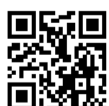
Ersatzhaltestelle Richtung Treuenbrietzen

* Fahrradmitnahme im Schienenersatzverkehr nur begrenzt möglich. Im QR Code sind die Koordinaten der Ersatzhaltestelle hinterlegt.